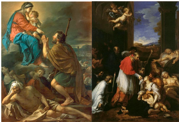
À gauche : Saint Roch intercédaant pour les pestiférés